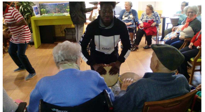
Cours particulier et participation des résidents au concert !