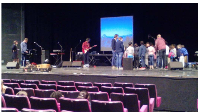
Des classes de l'école Romain Rolland, en visite au Cadran, lors de la répétition de la Compagnie Monsieur Lune.

Le prochain numéro du Journal du REP+ retracera ces cinq aventures artistiques des plus passionnantes.