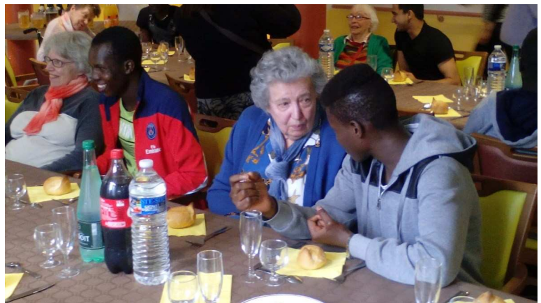
Chaque correspondant et son binôme pour un vrai temps de partage !

Ces liens privilégiés ainsi créés perdureront grâce à la poursuite du projet en 2016-2017 .