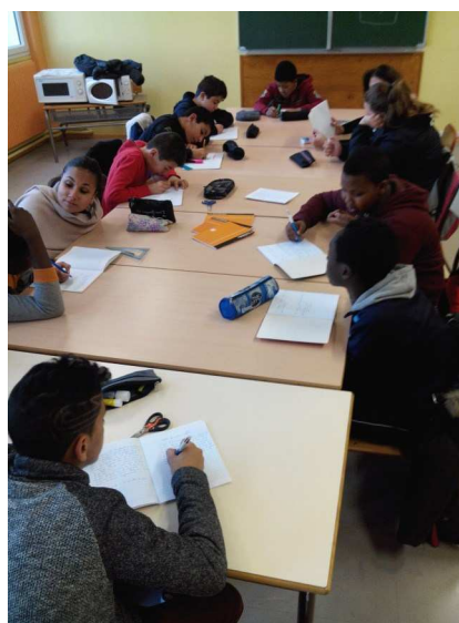
Rencontrer un auteur, c'est aussi comprendre et s'impliquer dans un projet d'écriture.