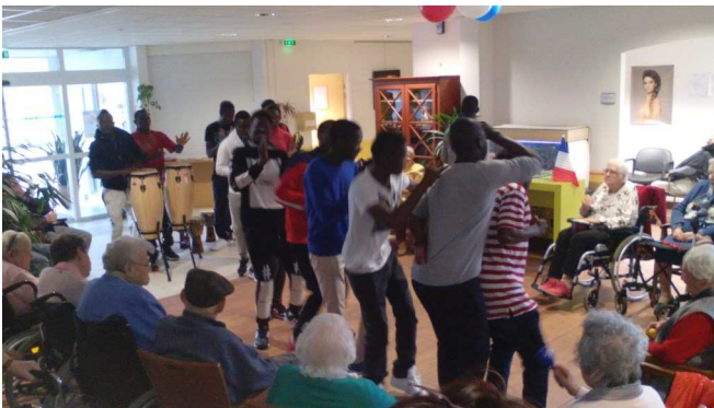
Spectacle de danse et de percussions offert par les collégiens de la classe UPE2A-NSA.