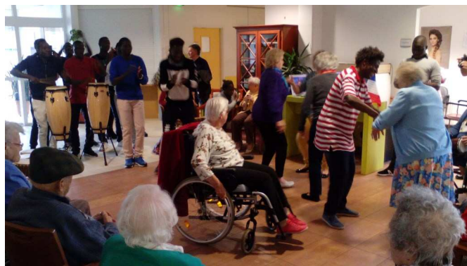
Fin de spectacle en apothéose, quand des résidents sont venus spontanément danser avec les collégiens sur la piste !