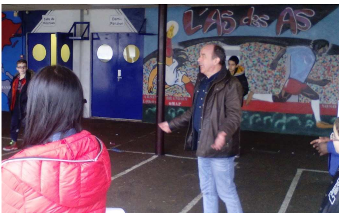
Mettre en voix des textes anciens et rouler les R, un pari réussi !